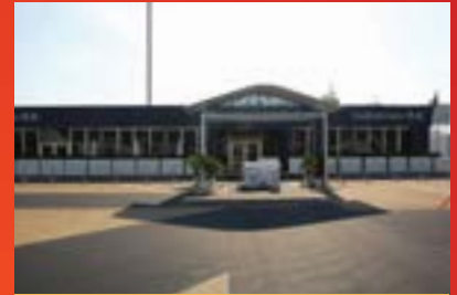
350 平方米贵宾楼 标准图形广告牌

ABACE2020 的交钥匙型贵宾楼和定制型贵宾楼面积从 100 平方米到 400 平方米不等。