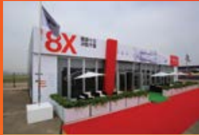
200 平方米贵宾楼 标准图形广告牌