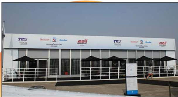
双联定制贵宾楼，使用升级版广告板