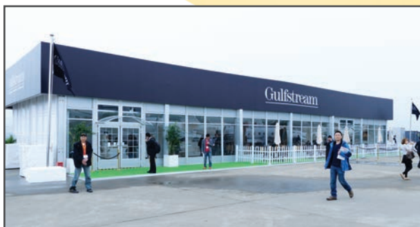
三联定制贵宾楼，使用升级版墙体广告板