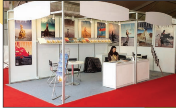
双联标摊； 墙壁广告另收费用